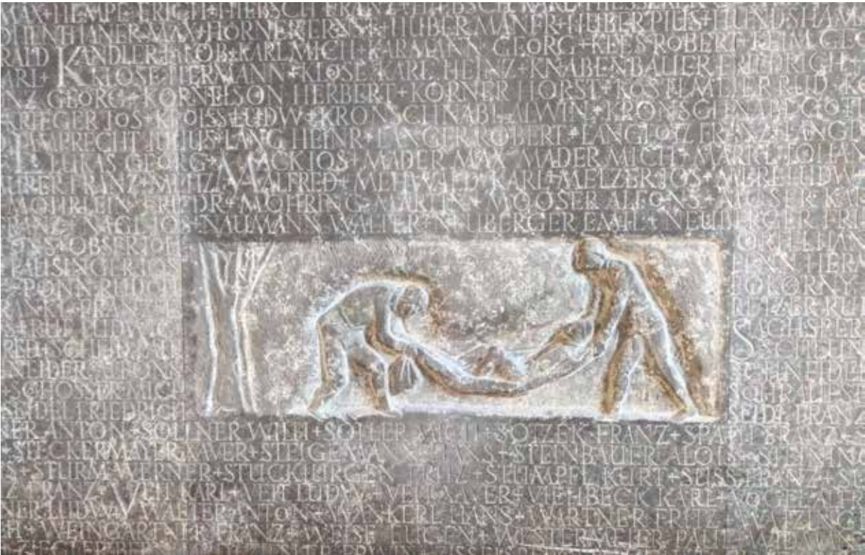
Max Faller: Verwundung; Ausschnitt aus der Erinnerungstafel in der Oswaldkapelle aus Muschelkalk