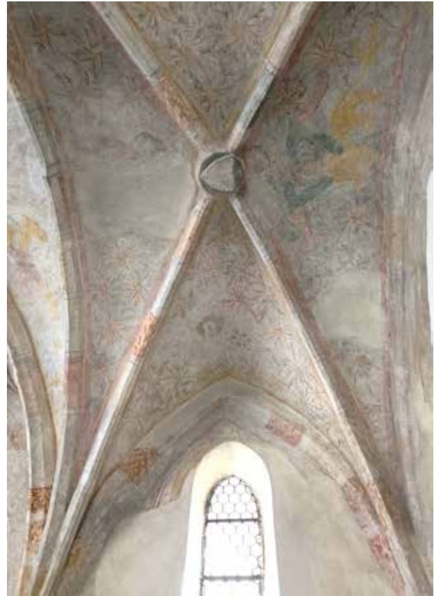
Gotisches Kreuz und die ältesten Fresken der Stadt Deggendorf in der Apsis der Oswaldkapelle